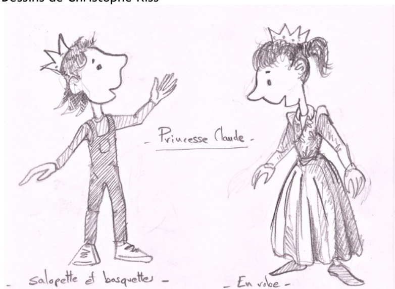
Princesse Claude (Petite Sœur)