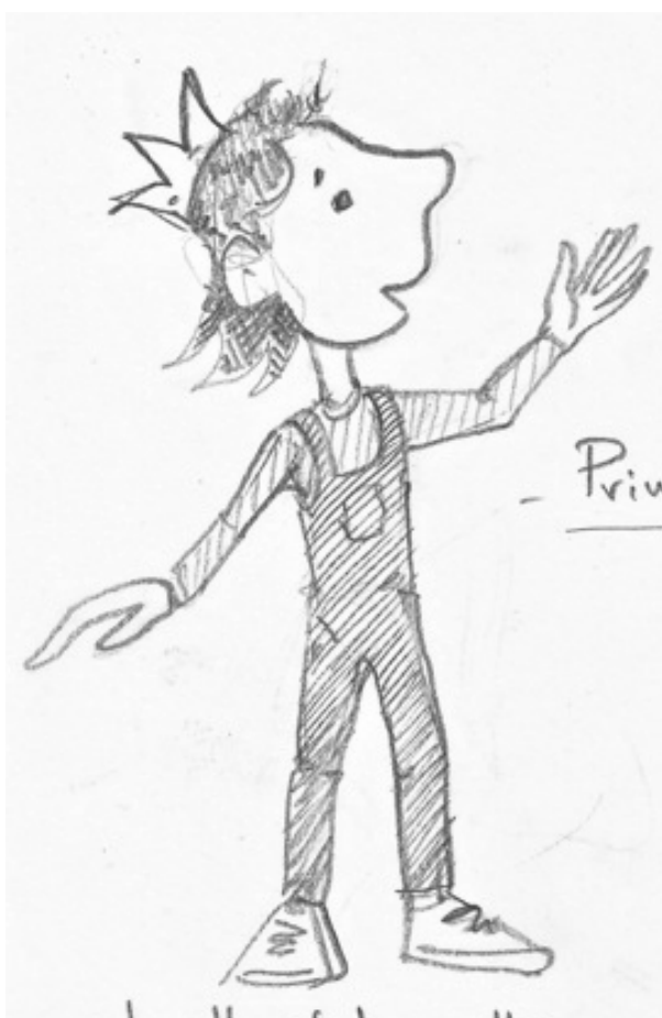
Illustration de Christophe Kiss

Un projet d'adaptation pour le théâtre jeune public (6-12 ans) pour 4 comédiens et 10 marionnettes de table